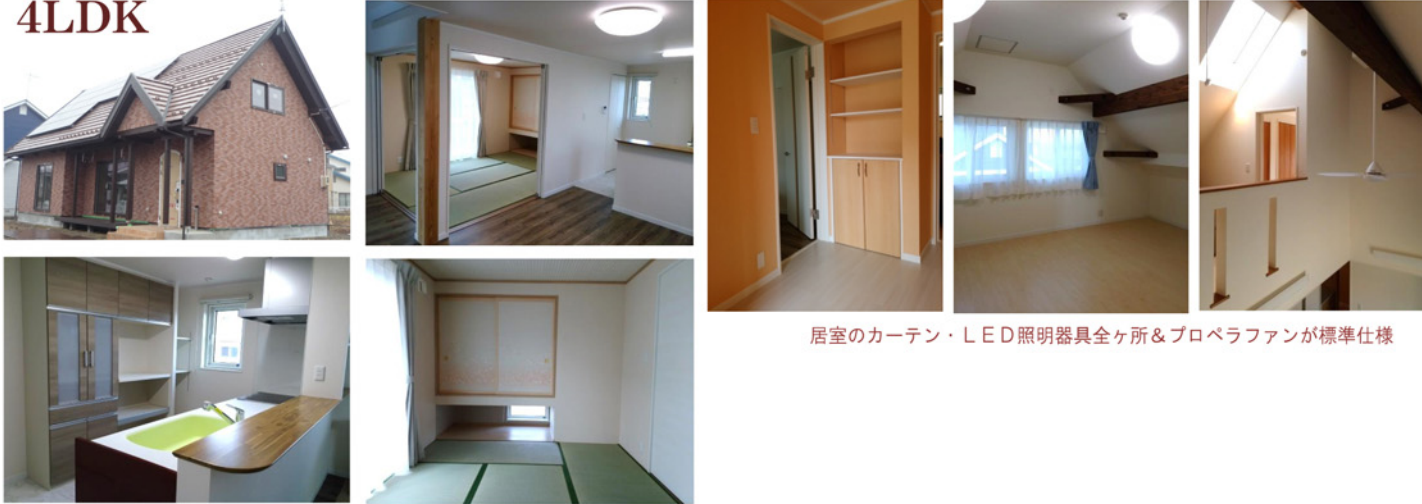
居室のカーテン・LED照明器具全ヶ所&プロペラファンが標準仕様